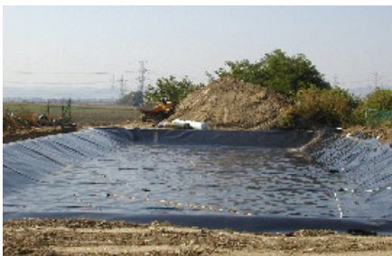
Foliendichtung für Bodenfilter 9/2003