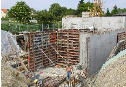
Schalungsarbeiten - Nutz - wasserbecken 6/2003