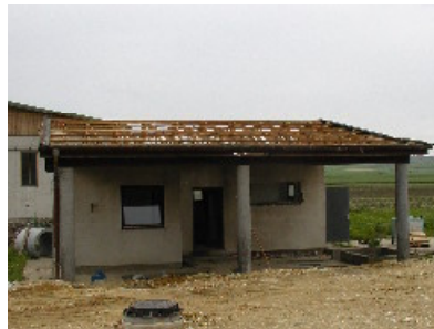
Abbruch des alten Betriebs- gebäudes 5/2004