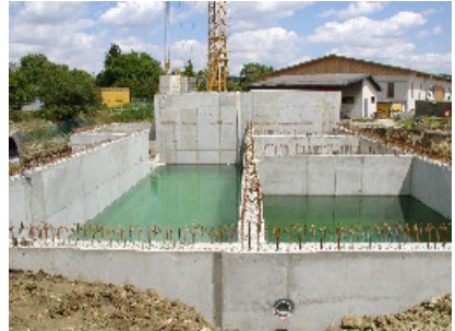
Dichtheitsprüfung von Regenrück- haltebecken und Nutzwasser- becken 7/2003