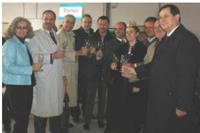
Ehrengäste am Tag des Stettner Weines am 30.4.2006