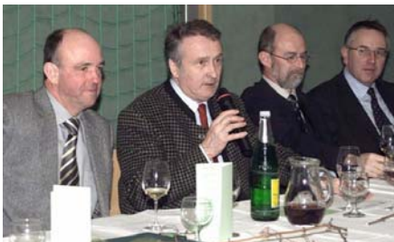
Weinverkostung am 09.03.2006 im Turnsaal der Volksschule

Im Rahmen einer Sondergemeinderatssitzung wurden verdienstvolle Personen, die sich jahrzehntelang in den verschiedensten Funktionen für Stetten eingesetzt haben, geehrt. Ich möchte auf diesem Wege nochmals meinen Dank an die „Ausgezeichneten“ für ihre erbrachten Leistungen aussprechen.