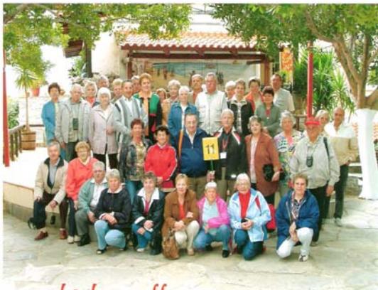
Frühjahrstreffen Kreta 2006

Das diesjährige Frühjahrstreffen des Pensionistenverbandes führte in der Zeit vom 03. bis 10. Mai 2006 in den sonnigen Süden auf die griechische Insel KRETA .