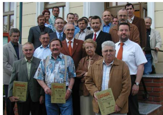
Der Gemeinderat der Gemeinde Stetten mit den Geehrten Sondergemeinderatssitzung am 18.5.2006

Ich wünsche allen Stettnerinnen und Stettnern einen schönen Sommer, einen erholsamen Urlaub, eine ertragreiche Ernte und unseren Kindern schöne Ferien.