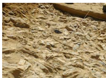
Versteinerte Auster und Muscheln am Teiritz

↖ „Austerngrabung“ am Teiritz im August/September 2005.