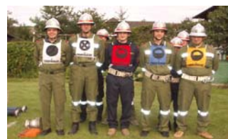
3. Platz der Mannschaft „Gruppe Stetten“ beim „Nasswettkampf“ am 27.08.2005