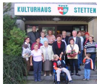
10 Jahre „Wir Stettner Frauen“ am 01.10.2005

↖ „Austerngrabung“ am Teiritz im August/September 2005.