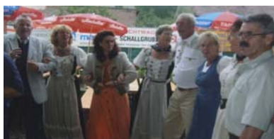
Feuerwehrfest vom 26.08.-28.08.2005